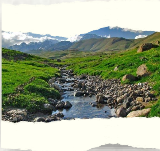
سرعین : ۲.۰۰۰.۰۰۰ تومان