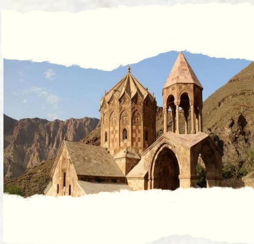
جلفا : ۱.۵۰۰.۰۰۰ تومان