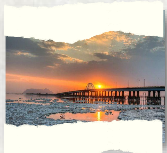
ارومیه : ۱.۷۰۰.۰۰۰ تومان