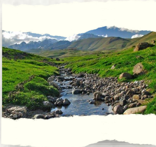
سرعین : ۲.۰۰۰.۰۰۰ تومان