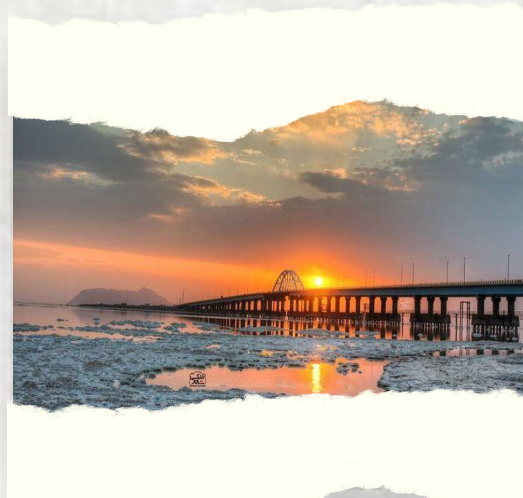
ارومیه : ۱.۷۰۰.۰۰۰ تومان