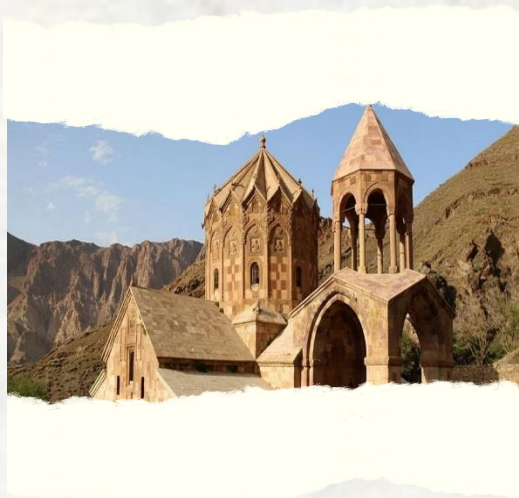
جلفا : ۱.۵۰۰.۰۰۰ تومان