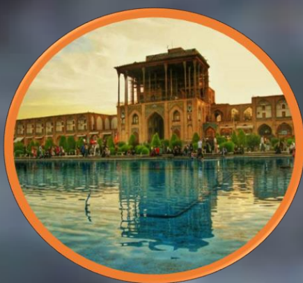
کاخ عالی قاپو