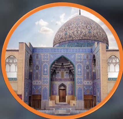
مسجد شیخ لطف الله