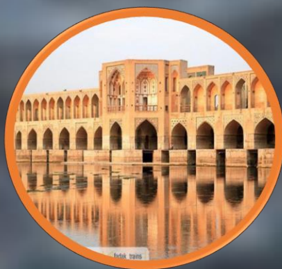
سی و سه پل و پل خواجه