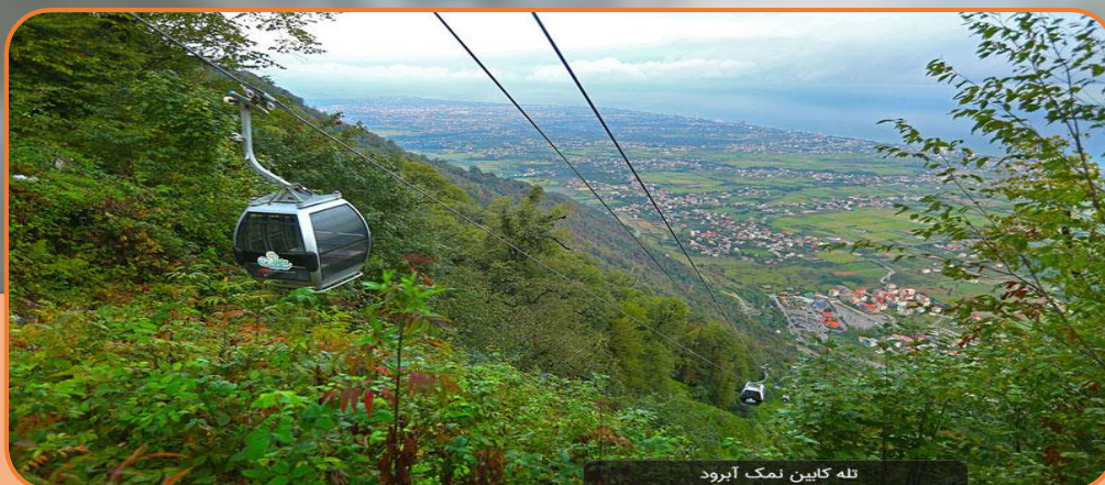
تله کابین نمک آبرود