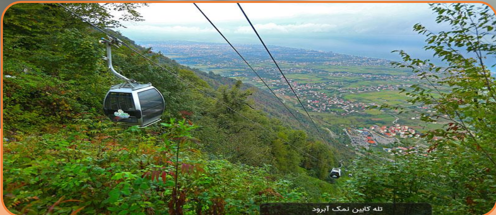
تله کابین نمک آبرود